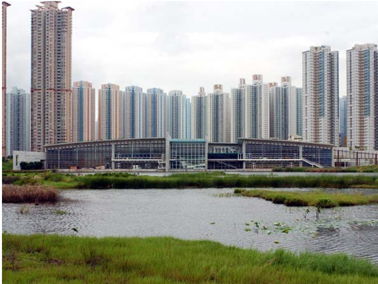
Fotografía 1 – Edificio de visitas del Parque para la conservación de humedales de Hong Kong