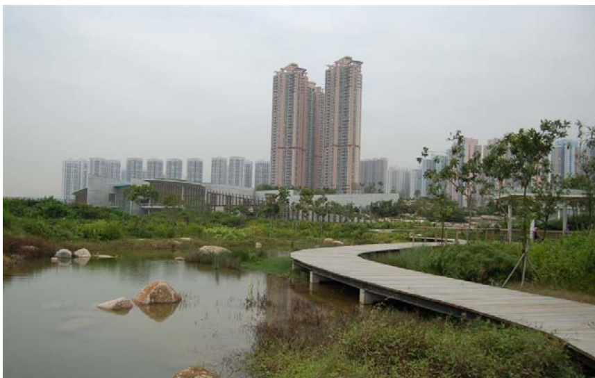
Fotografía 3 – Pasarela del parque para la conservación de humedales de Hong Kong