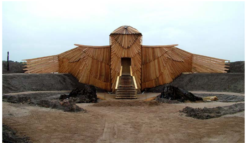
Fotografía 2 – Paranza con diseño de aguilucho (centro WWT Martin Mere)